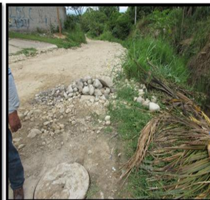
JR. TARAPOTO CON JR. CUMBAZA: En las imágenes se puede observar la limpieza del material de afirmado y la ubicación de la nueva tapa de buzón.