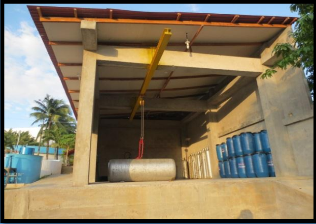
Construcción de la Caseta de Bombeo - Lamas