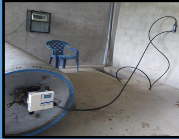
Construcción de la Caseta de Operadores y Almacén - Lamas