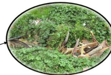
JR. TARAPOTO CON JR. CUMBAZA: Inicialmente el buzón se encontraba rellenos con material de afirmado y cubierta con hojas.