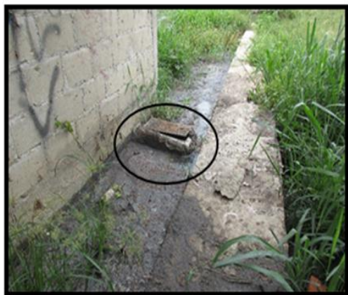
PSJ. 28 DE JULIO: En las imágenes se observan las zonas inundadas por aguas servidas.